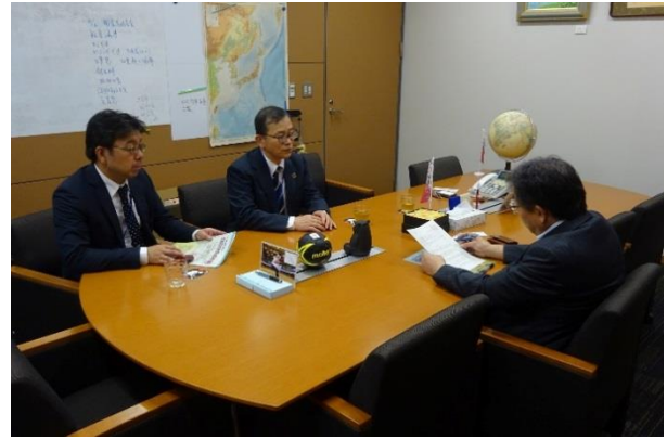
自民党木原 稔議員へ要請（秘書対応）