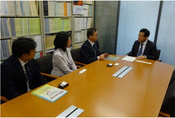
共産党宮本 徹議員へ要請（議員対応）