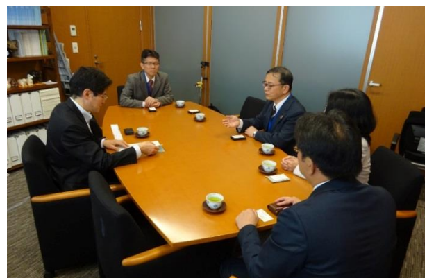
自民党石田昌宏議員へ要請（政策秘書対応）