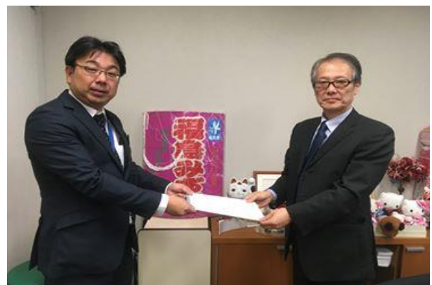
社民党福島みずほ議員へ要請（秘書対応）