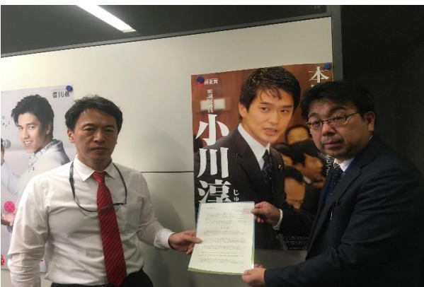
立憲民主党小川淳也議員へ要請（秘書対応）